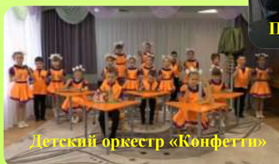
Детский оркестр «Конфетти»