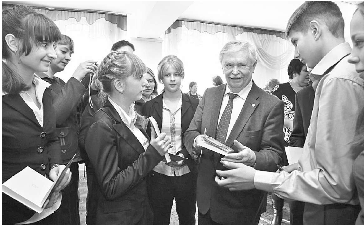
Альберт Лиханов в Грайворонской районной библиотеке

ПОЧЕМУ ЧИТАТЕЛЕЙ ПРОИЗВЕДЕНИЙ АЛЬБЕРТА ЛИХАНОВА МОЖНО НАЗВАТЬ НРАВСТВЕННЫМИ ЛЮДЬМИ