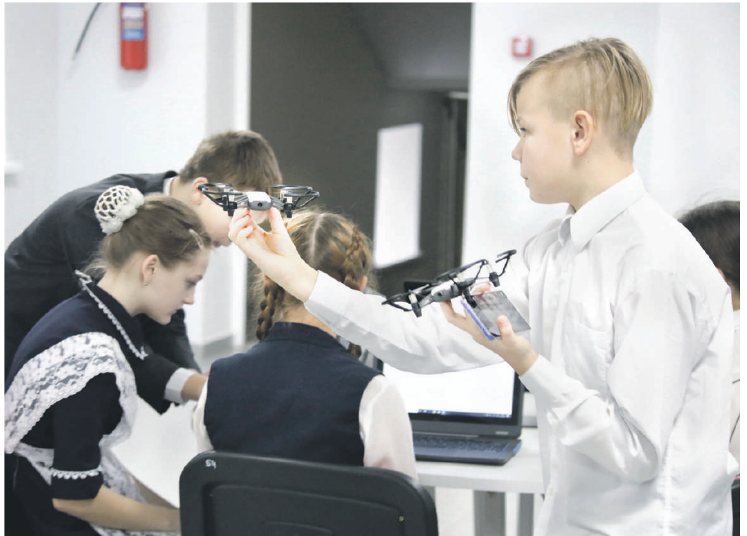
Квадрокоптерами сейчас даже в сельской школе никого не удивишь. С ними легко справляются в «Точке роста» Ровеньской школы № 2

На занятии внеурочной деятельности у младших школьников «Начинаем изучать английский язык» нам показали, как можно использовать флеш-карты (не компьютерные флешки, а карточки