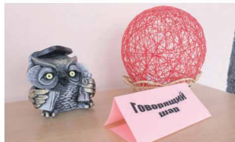
«Говорящий шар» в школе с УИОП. Ученики бросают в него свои отзывы и пожелания