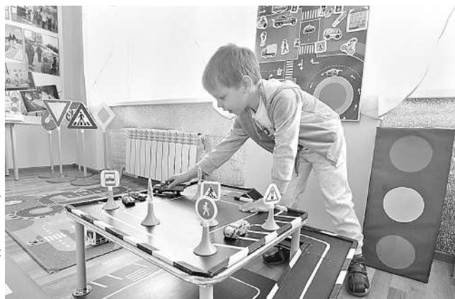
В детском саду «Сказка» пос. Ивня