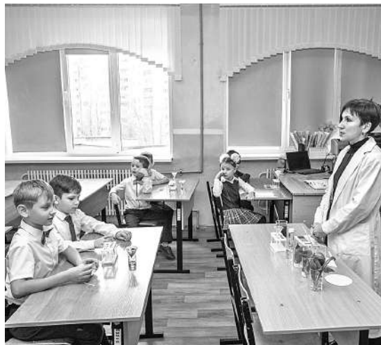
Шуховцы изучают кислотность почв