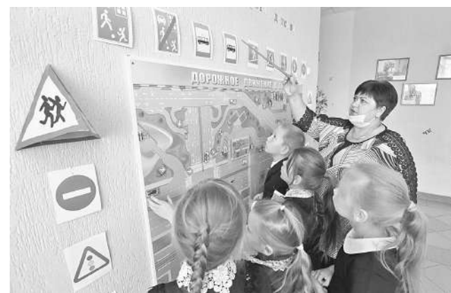
В Клименковской школе Вейделевского района

действию этих мероприятий на конкретного ребёнка сиюминутно, потому что результат, как правило, отдалён во времени, к тому же отсутствуют измерители воспитанности и сформированности навыка поведения на дороге. Но ни одна школа не стоит в стороне от этой работы.