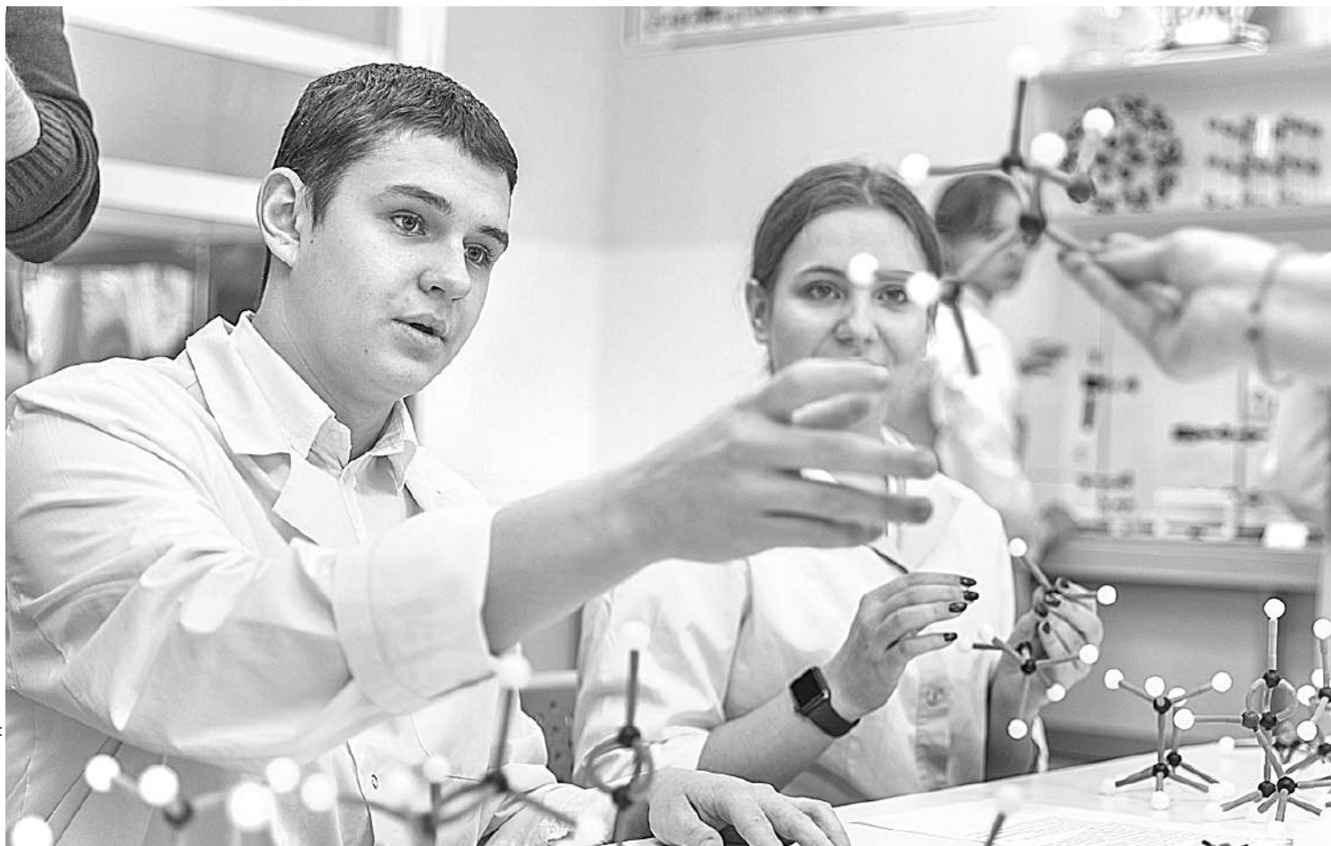
В химической лаборатории Шуховского лицея

В СОЦИАЛЬНЫХ СЕТЯХ ПОЯВЛЯЛОСЬ МНОГО СООБЩЕНИЙ О ТОМ, ЧТО СИТУАЦИЯ С КОРОНАВИРУСОМ — ЭТО ОСНОВАНИЕ ДЛЯ ПЕРЕВОДА ВСЕЙ СИСТЕМЫ ОБРАЗОВАНИЯ В ДИСТАНЦИОННЫЙ ФОРМАТ НА ПОСТОЯННОЙ ОСНОВЕ. УБЕЖДАТЬ НАРОД, ЧТО ТАКИЕ ЗАЯВЛЕНИЯ ОДНОЗНАЧНО БЕСПОЧВЕННЫ, НАМ СУЩЕСТВЕННО ПОМОГАЛ ОПЫТ ШКОЛ РАН, КОТОРЫЕ ПРОДЕМОНСТРИРОВАЛИ, ЧТО ОБРАЗОВАНИЕ — НЕ ТОЛЬКО ПРИОБРЕТЕНИЕ СУММЫ ЗНАНИЙ, НО ЭТО, ПРЕЖДЕ ВСЕГО, СОЦИАЛИЗАЦИЯ РЕБЯТ, ПЕРЕДАЧА ОПЫТА ПОКОЛЕНИЙ, ДУХОВНО-НРАВСТВЕННЫХ ЦЕННОСТЕЙ, ЧТО ЯВЛЯЕТСЯ НЕВОЗМОЖНЫМ БЕЗ ЛИЧНОСТИ УЧИТЕЛЯ, БЕЗ НЕПОСРЕДСТВЕННОГО ВЗАИМОДЕЙСТВИЯ С УЧЕНИКОМ, БЕЗ УЧАСТИЯ РЕБЁНКА В КОЛ-