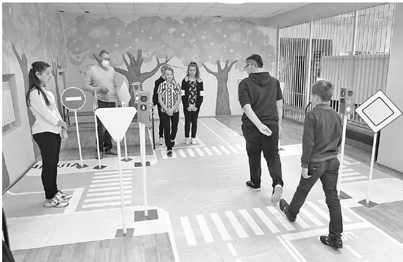
В Курасовской школе Ивнянского района

В наших школах во второй половине дня организованы пятиминутки безопасности перед уходом школьников домой, просмотр видеороликов, выступления агитбригад, проведение интеллектуально-познавательных и сюжетно-ролевых игр, целевых прогулок и экскурсий. Белгородская область принимает участие во всех всероссийских мероприятиях, которые рекомендованы Министерством просвещения Российской Федерации. Мы не можем делать выводы о воспитательном воз-