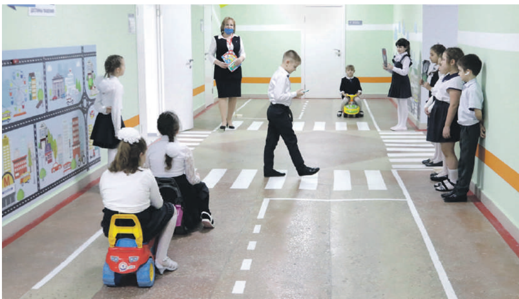
Занятия в образовательной зоне «Правила движения достойны уважения!» в школе № 2

ского творчества. Здесь занимаются и младшие школьники, для которых конструирование роботов — уже привычное дело. Как и для учеников школы с УИОП: в зависимости от возраста детей здесь действует два объединения дополнительного образования — «Робототехника» и «Введение в робототехнику».