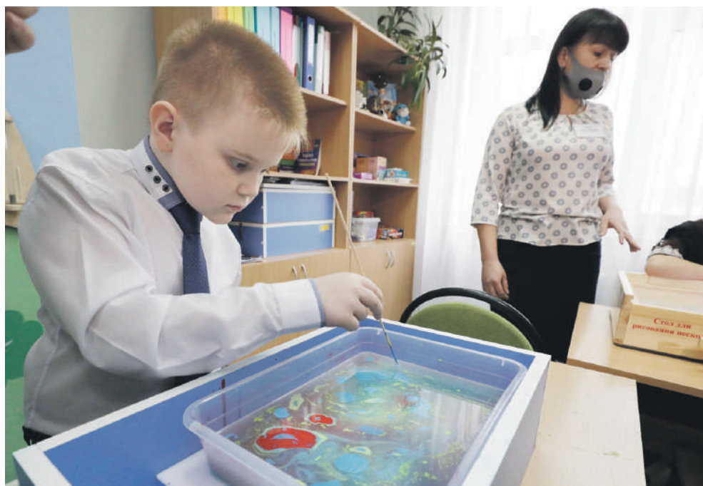
Занятие по акваанимации в Новоалександровской школе

Дальше директор ведёт нас в «деревню Йогуртово». Она расположилась в обычном классе, только вместо учебников и ручек на столе — йогурты, фрукты и другие начинки и добавки.