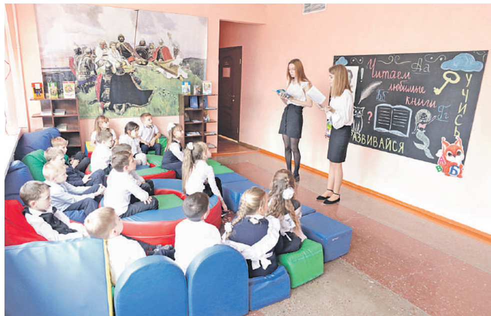
В рамках проекта «Дети — детям» старшеклассники читают книги ученикам начальной школы (Ровеньская школа с углублённым изучением отдельных предметов)