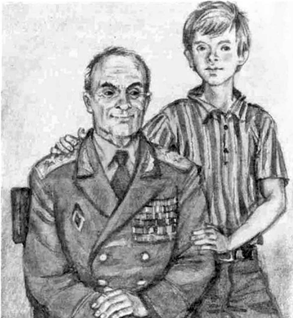
Иллюстрация к повести «Мой генерал» художника Юрия Иванова

ЧИТАТЬ СТАТЬЮ «ИСКАТЬ ДОБРО ВОКРУГ СЕБЯ» О КНИГЕ «НЕЗАБЫТЫЕ ИГРУШКИ»