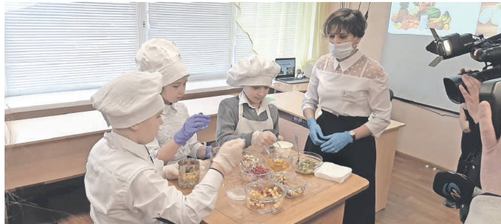
На внеурочке, посвящённой правильному питанию, ученики школы с УИОП готовят вкусные и полезные блюда