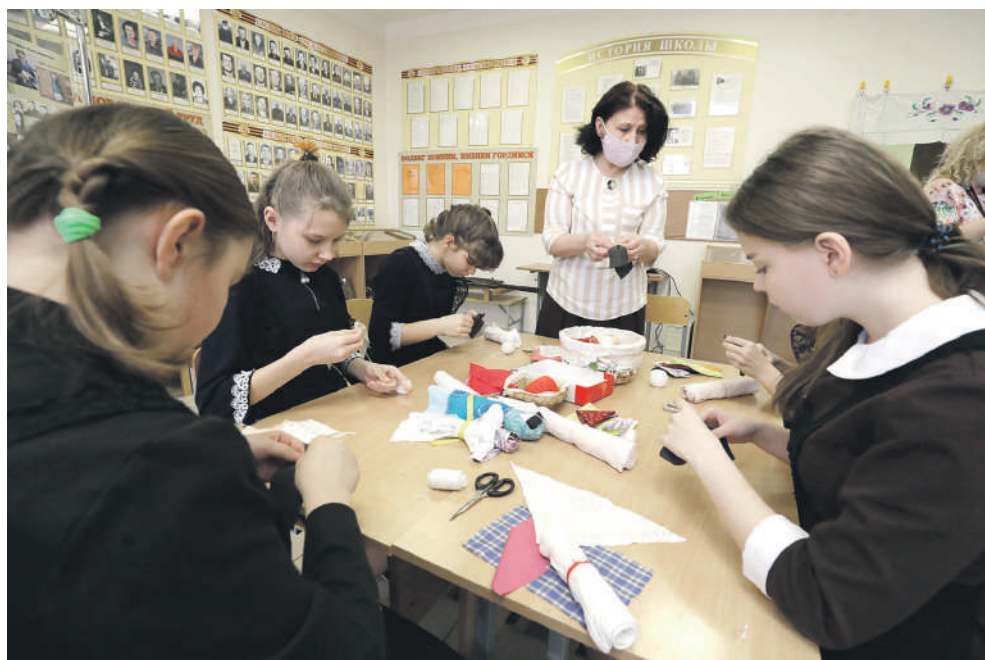
В рамках программы «Народная и авторская кукла» ученицы Новоалександровской школы учатся шить куклу-столбушку