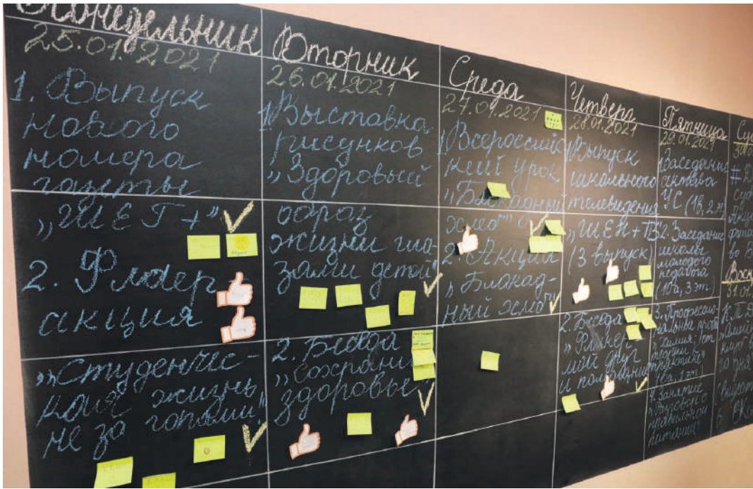
«Говорящая» стена в школе с УИОП