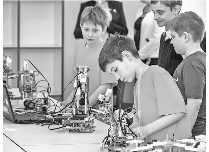
Студия робототехники Шуховского лицея