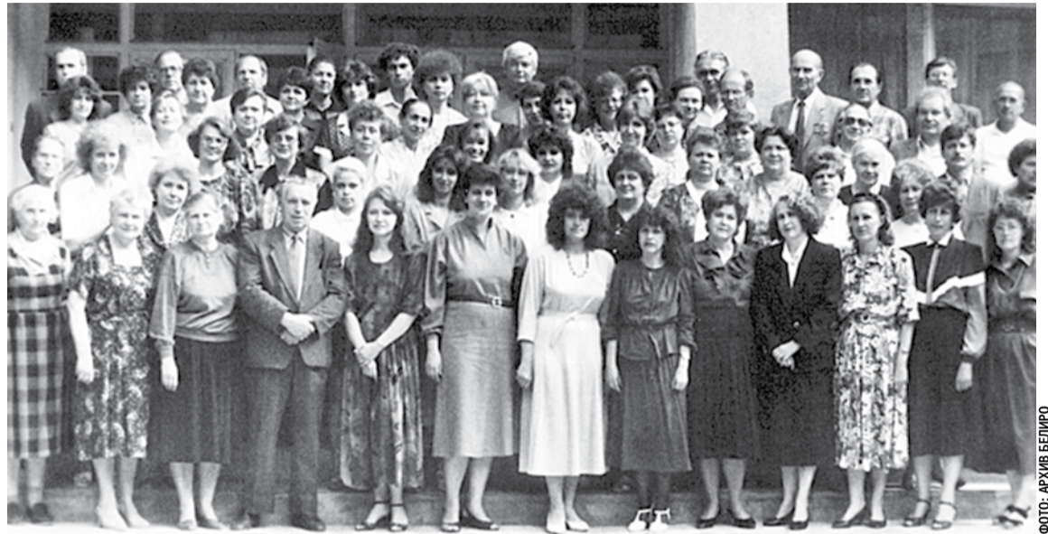
Коллектив Белгородского областного института усовершенствования учителей, 1994 год

Благодаря профессионализму, преданности своему делу, большому трудолюбию, таланту преподавателей, педагогов институт развивался, успешно выполняя свою главную миссию — повышать качество образования Белгородской области. Сегодня наш институт обладает высоким потенциалом, компетентным и работоспособным профессорско-преподавательским составом, который полон творческих планов и замыслов. Надеюсь, что всё это позволит нам эффективно реализовывать как региональные, так и федеральные инициативы. Желаю всем преподавателям и сотрудникам Белгородского института развития образования радости, профессиональных побед, счастья и любви близких, душевного равновесия, интересного и плодотворного учебного года!